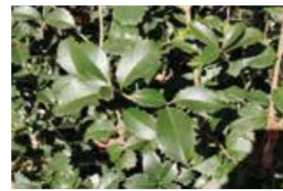
ヒイラギに似てる