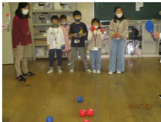
ポッチャを体験（桜山小学校）