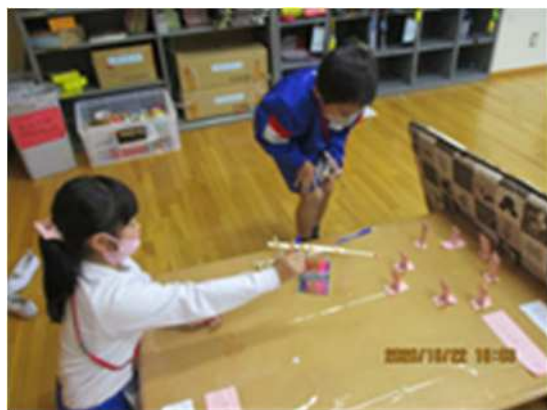
割り箸鉄砲で遊ぼう（新明小学校）