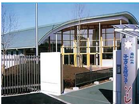
【子育て支援センター ソーレ】