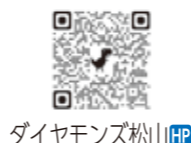
ダイヤモンド松山HP