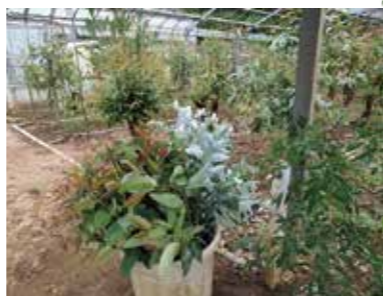
温室で収穫した枝