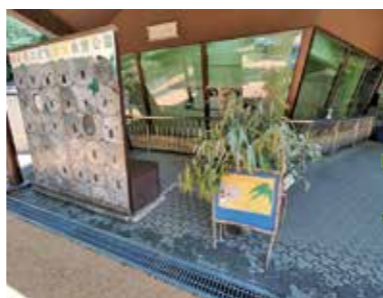
お待ちしています