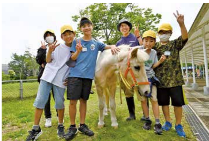
ポニーと触れ合えて楽しかった

6月27日(火)、桜山小学校の6年生が総合的な学習の時間に「埼玉県こども動物自然公園」を訪れました。「動物の命とそれを支える人の努力と工夫」をテーマに、班に分かれて、観察予定の動物が普段何を食べているのか等を事前に調べていました。また、飼育員さんに動物を観察している中で気づいたことや動物の特徴、飼育する上で気をつけていることなどを自発的に質問したり、学習用端末を使って撮影したりして、動物のことをもっと知ろうとしていました。