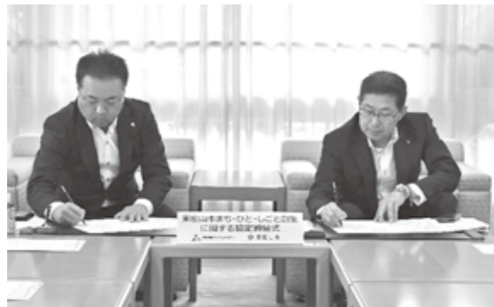
協定を結ぶ宮崎代表取締役と森田市長