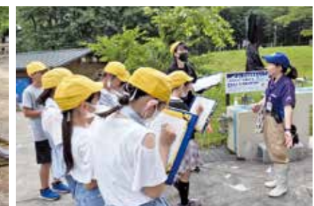
飼育員さんへの質問コーナー