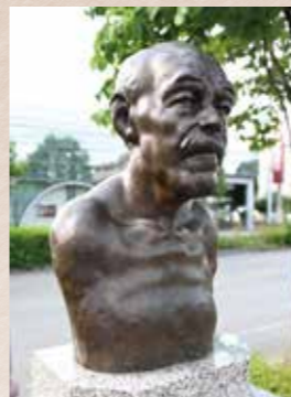
高田博厚作「高村光太郎」

高田博厚は友人に連れられ、19歳の時に高村光太郎のアトリエを訪ねました。高村は17歳下の高田に対等に接し、彫刻の道へと導きました。高村は高田にとって唯一の先輩であり、友でした。