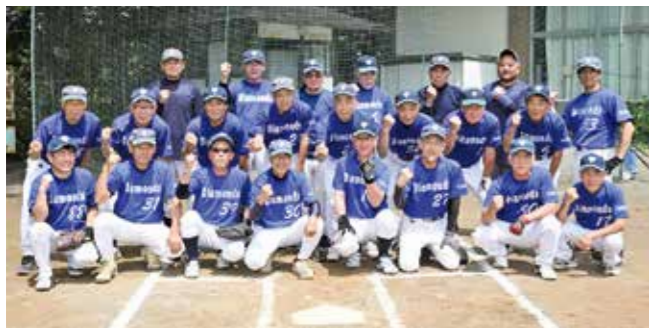
ダイヤモンド松山の皆さん

10月28日(土)～31日(火)に愛媛県で開催される「第35回全国健康福祉祭えひめ大会(以下:ねんりんピック)※」へ出場を決めた、ダイヤモンド松山を紹介します。