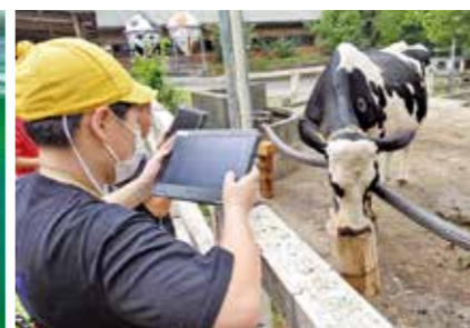
乳牛の大きさにびっくり