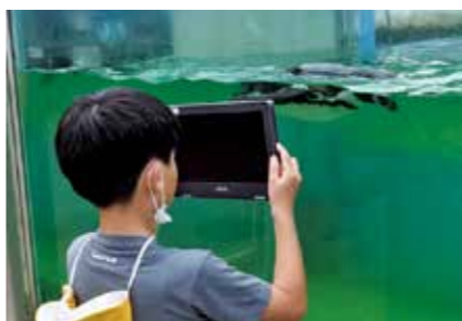
泳いでいるペンギンを撮影

子どもたちは「飼育員さんが優しくうれしかった」「夏休みになったらまた家族で来たい」などの感想を話してくれました。