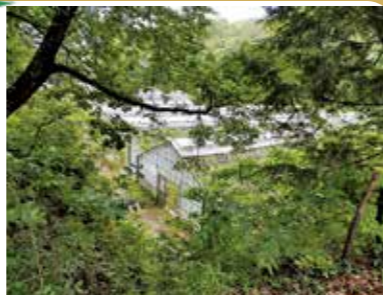
ユーカリを栽培している温室