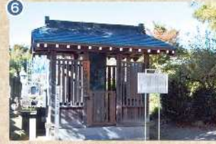
6 【弘安四年銘板石塔婆】 小代郷を本貫地とした小代氏の武功を願うとともに、小代重俊の功徳を称え造立したものです(県指定文化財)。