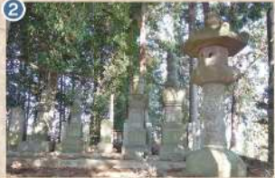
2 【加賀爪氏累代墓】 当地を知行していた旗本 加賀爪政尚、忠海、直道三代ほか一族の墓石群で、中世城館跡・高坂館跡の土塁上にあります(県指定文化財)。