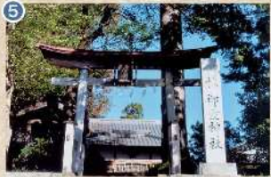
5 【御霊神社】 鎌倉御家人小代氏が頼朝の兄である悪源太義平公を祀った神社です。夏祭りには、「段物」と称する舞台上で神楽を演じる(正代祭りばやし)が演奏されます(市指定文化財)。