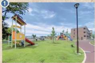
1 【さくら坂公園】 大小複合遊具や砂場、健康遊具があります。