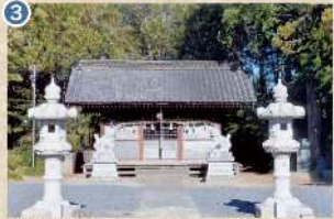
3 【高坂神社】 祭神は日本武尊で、古くは八剣神社と呼ばれていました。平成23年、高坂神社に隣接する高坂8号墳から、埴玉京初となる三角縁神獣鏡(三角縁陳氏作四神二獸鏡)が発見されました。