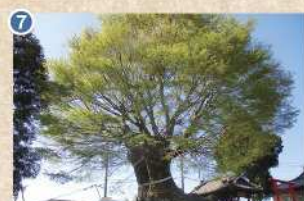
7 【八幡神社の大樟】 台地のはずれの段丘上にあり、樹齢700年と推定されています(市指定文化財)。