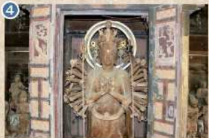
4 【世明寿寺千手観音立像】 南北朝時代。一本海、玉眼、素地仕上げの仏像で、尊皇として二十八部衆と鬼神・雷神を従えています(市指定文化財)。