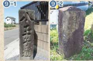
9-1 【道標：八王子道】 9-2 【道標：大黒部坂下】 高坂1丁目(9-1)と大黒部坂下(9-2)の道標で、札所巡礼に関する石造物です(9-1は市指定文化財)。