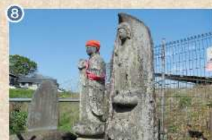
8 【八幡神社前庚申塔】 寛文11年の路で、阿弥陀像と三猿、二鶏が刻まれています(市指定文化財)。