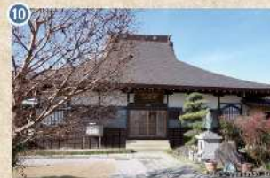
10 【長松寺】 本尊は阿彌陀如來。高坂小学校の前身である高坂学校として使用されていたことがあります。