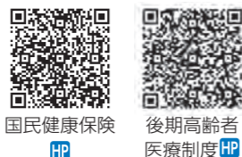
国民健康保険 HP 後期高齢者医療制度 HP