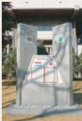
姉妹都市提携記念碑

東松山市の外国人登録者数が増加している中、市内の自動車関連の部品メーカーが外資系となったため、ドイツ人を始めとする多くの外国人が頻繁に来訪。また海外から大東文化大学への留学生が増えるなど、東松山市では、いろいろな国籍の外国人の姿が見受けられるようになりました。