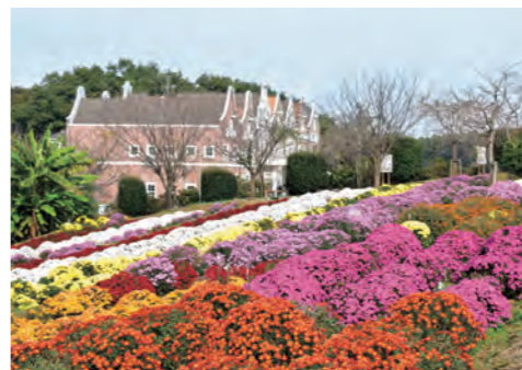
ざる菊(風車の見える丘)