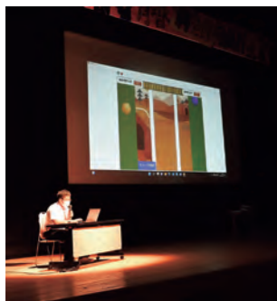
自作のゲーム発表