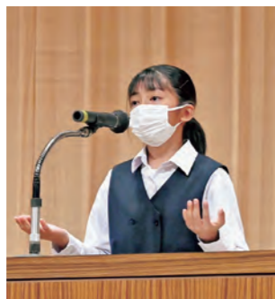
英語で思いを伝える