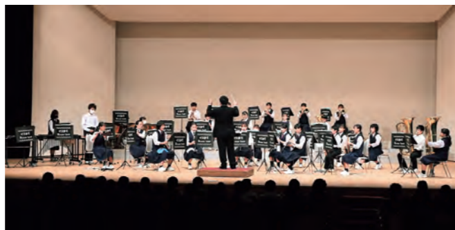
会場全体を包み込んだ演奏