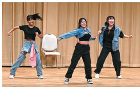
息の合ったダンス

9月17日(土)、市民文化センターで東中学校の文化祭「しらすぎ祭」が3年ぶりに行われました。