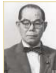
山口六郎次 1961年(昭和36年)11月授与。衆議院議員として、国政や市の発展に寄与。