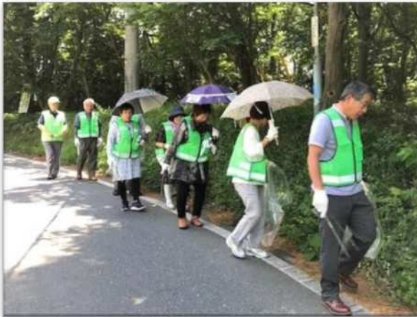
道沿いのごみ拾い「車に気をつけよう！」