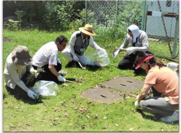
裏庭の草取り「小さい草も取る？」