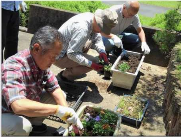
プランターの花植え「元気に育て♡」