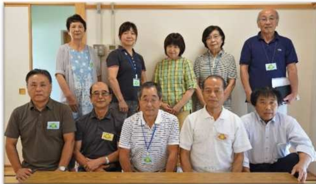
第18期生 広報委員会メンバー

多くの方のご協力を頂き、第18期生広報「きらめきNo.1」を無事に発行することができました。ありがとうございました。 入学式も記事に出来ていればと思うのですが、その時は、広報委員会の存在さえ知らず、立派な式にのみ込まれていました。学園祭、グラウンドゴルフ大会、学部別自主企画、様々な講義など、この先どんな学園生活が展開されるのか、ワクワクしています。今後も広報委員一同、力を合わせて活動しますので、ご協力をお願い致します。