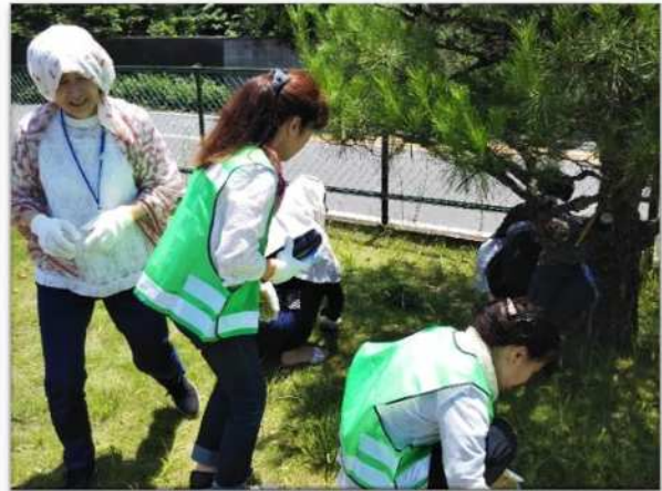
前庭の草取り「きれいになるね。」