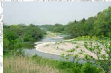
旧唐子橋跡から「天の園」の舞台を望む