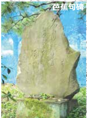
芭蕉句碑 名月の花 かと見えて 縁はたけ 芭蕉(統「猿蓑」より) 綿之昭建芭明 作の和て蕉治 りあ3ら二 をたり0れ百十 して年た回年 てて頃。忌に いはまで