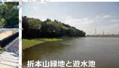
折本山緑地と遊水池