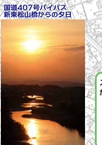
国道407号バイパス 新東松山橋からの夕日