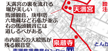
天満宮の裏を流れる堀が美しい馬頭観音、庚申塔六地藏など石仏が並ぶ右の馬頭観音には道しるべがある 市内最古の大給馬が残る観音堂 青押集落農業センター