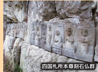
四国札所本尊刻石仏群