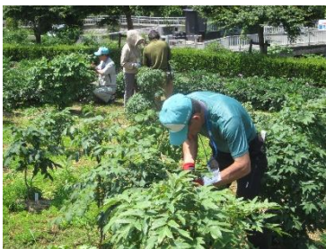
芽かきを実施しました。