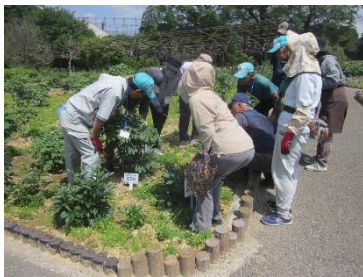
芽かき方法の講義実演

5月の初旬にボタンが開花した後に花摘みを行いました。その後、新しい芽が複数出てきています。来年咲かせる花の芽を残して新芽を取り除く作業を行いました。