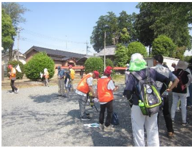
金谷の氷川神社で休憩

5月の月例ウォーキングは、野本の文化財を訪ねる西コースに38名が参加しました。高坂丘陵と同時開催日であったため、参加者が少なめでした。野本市民活動センターを出発時点で気温が22度でしたが、天気も良く快適なウォーキングになりました。途中3回の水分補給の休憩を取り、約6キロのコースを歩きました。