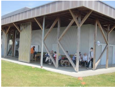
いなほてらすで3回目の休憩