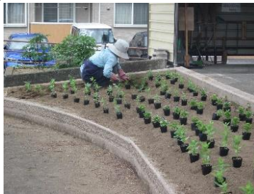
センター西側花壇に植付

令和8年5月27日(水)野本市民活動センター内の花壇に、夏の花の苗を定植しました。今年度はフラワーサポーター4名の協力と、野本市民活動センター地域活動推進員の合計5名で4ヶ所の花壇に、マリーゴールド、千日紅、ジニア、アゲラタムなど400株の花の苗を定植しました。6月～8月にかけて成長し綺麗な花が咲きます。