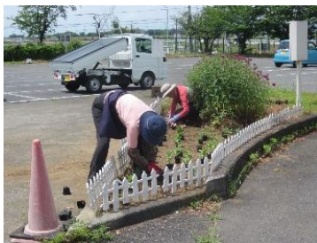
駐車場中央花壇に植付