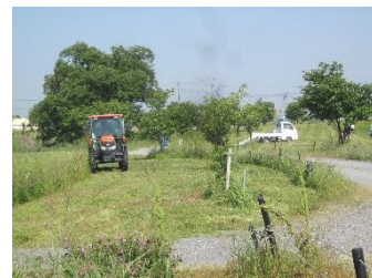
さくらの里東側除草作業