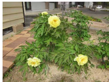
5日遅れて黄色が開花