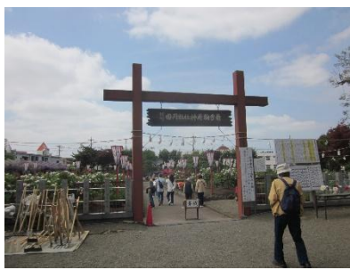
箭弓稲荷神社 牡丹園

4月22日(水)箭弓稲荷神社牡丹園コースに120名が参加しました。当日は、令和7年度の完歩賞・努力賞の授与を行った後に出発しました。朝の気温が13度でしたが、箭弓稲荷神社に着いた9時30分頃には気温が20度になり適温となり、箭弓稲荷神社の牡丹園は満開の状態でした。今回は約6kmのコースを約2時間で歩きました。