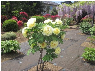
牡丹と藤が満開でした。