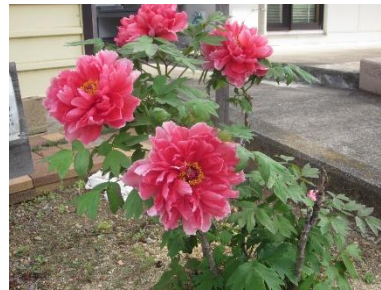
赤色の「ぼたん」が咲きました

令和4年10月に野本市民活動センターに牡丹3株を移植しましたが、今年も4月17日(金)に見事に大きな花を咲かせました。牡丹は1株に4〜5輪咲くように芽かきをしています。多数の花を咲かせると根の養分が不足して株本体が弱つてしましますので、開花後すぐに花を切り落とすと来年も大きな花が咲きます。