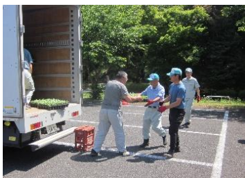
ポット苗の受け入れ

5月11日(月)花いっぱい活動のハーフ苗を野本11地区に配送しました。花の種類は、千日紅(ピンク)、シニア(ミックス)、アゲラタム(ブルー)、トレンシア(ミックス)、ヒポエステス(ピンク)、メネシア(ミックス)の6種類です。各地区の花いっぱい活動推進員様には協力頂きありがとうございます。