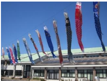
元気よく泳ぎました。

野本地区以外の方でも構いません、皆様の家で飾らなくなつた「鯉のぼり」がございましたら寄贈して頂きたいです。野本市民活動センターに掲揚いたします。「鯉のぼり」は、中型(7m×4m)小型(3m×1m)を提示して頂ければ幸いです。 ※「吹き流し」は引き取り出来ませんのでご了承下さい。