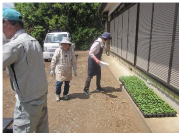
各地区にポット苗配送