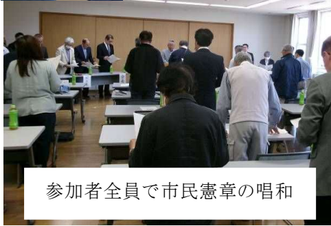
参加者全員で市民憲章の唱和