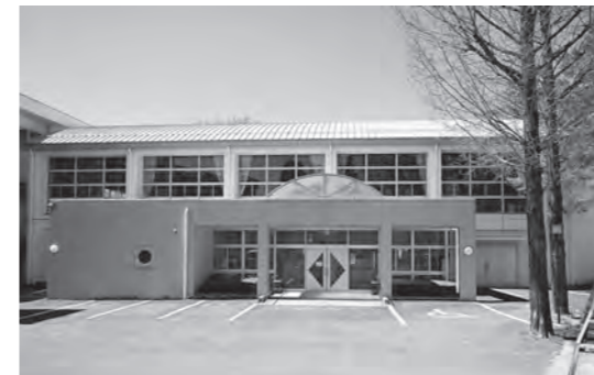
小学校体育館空調設備等設置