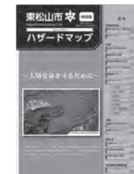
東松山市ハザードマップ