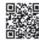
地方税お支払サイトHP