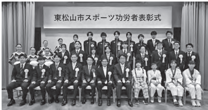
東松山市スポーツ功労者表彰式