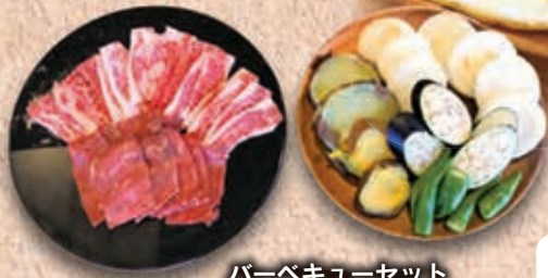
バーベキューセット