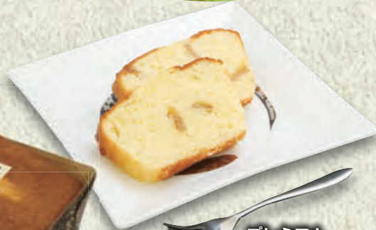
プレミアム 梨パウンドケーキ