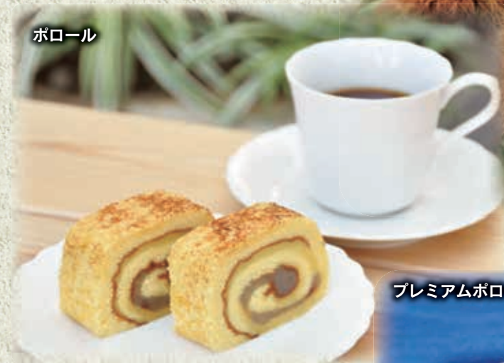
プレミアムポロール