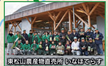
東松山農産物直売所 いなほてらす