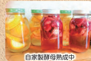
自家製酵母熟成中