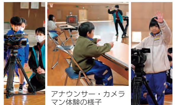
アナウンサー・カメラマン体験の様子