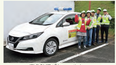
青色防犯パトロールカー

例えば、高坂丘陵地区では「あいさつ運動」を実施し、地域の小・中学生によるポスターや標語募集を通じて「あいさつ」を習慣化する取組が根付いています。