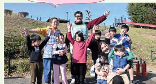
副会長3人と自治会の子どもたち

会長・副会長 目下の目標は、自治会の公民館を新築することです。拠点があれば様々な活動の幅が広がります。子どもや高齢者向けのイベントなど、自治会員の交流の場になってほしいです。公民館の新築に夢がふくらみます💡