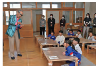
マジックに興味津々