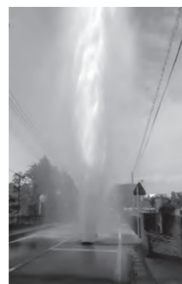
経年劣化による水道管の破損（令和5年 若松町）

本市の水道は、県営水道からの受水と自己水（浅井戸）を水源として、市内全域に配水しています。将来