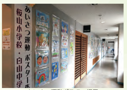
あいさつ運動ポスター掲示