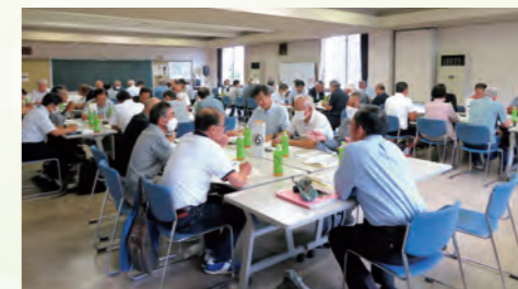
自治会連合会「交流会」で様々な自治会と意見交換

皆さん!自治会のチカラが失われてしまってから「やっぱり必要だった」と後悔しても遅いのです。ぜひこの特集を通じて、改めて自治会の重要性や必要性、そして加入についても考えてみてください。