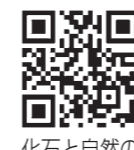
化石と自然の体験館HP