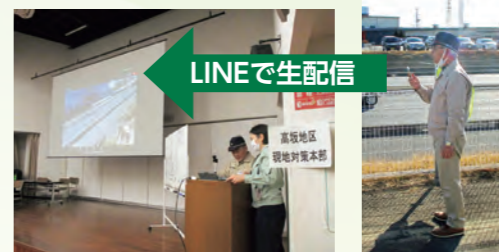
LINE WORKSを活用した防災訓練の様子(高坂地区)