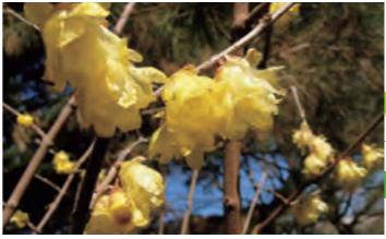
艶やかなロウバイ