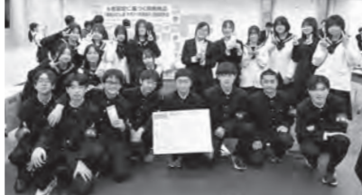
学生・生徒の皆さん

斬新! 甘辛コラボ。 東松山市の新名物として、皆さんに愛される商品になってほしい♪ ぜひ、ご賞味ください♪