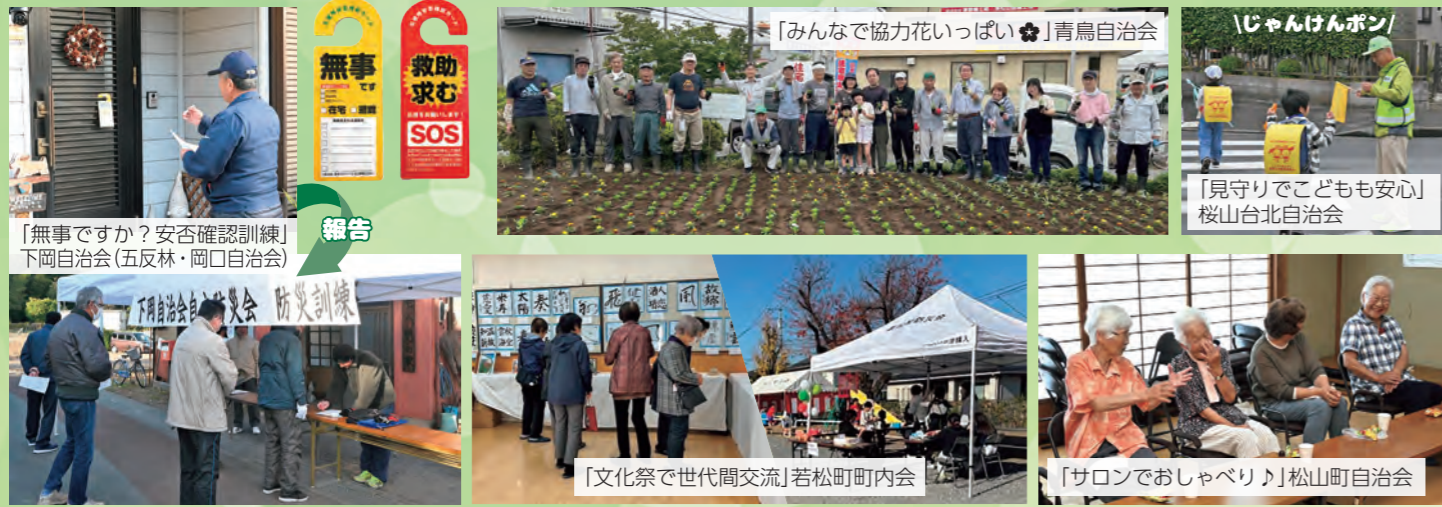
「無事ですか？安否確認訓練」 下岡自治会(五反林・岡口自治会)

皆さん、知っていましたか？「自治会は大切だ」と言うけれど、どんな活動をしているのか分からない人もいます。今回の特集では、そんな自治会活動の疑問を少しだけ紐解いてみたいと思います。 ※民生委員・児童委員や地域の子ども会やシニアクラブ、各種団体と協力して行っているものもあります。