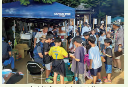
各自治会でイベント実施

A アパートやマンションの増加による住環境の変化、共働き世帯や高齢者世帯の増加に加え、新型コロナウイルス感染症の影響で自治会の活動を休止せざるを得なかったことが重なったことで、加入率の低下や、イベント参加者の減少が顕著となりました。 イベントへの参加は、各自治会の工夫により回復傾向にありますが、加入率の低下は、役員の負担増加や担い手不足にも直結しており、大きな課題となっています。