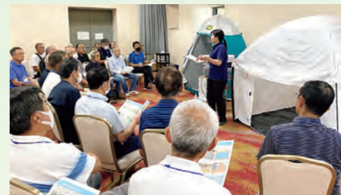
自主防災組織リーダー養成研修