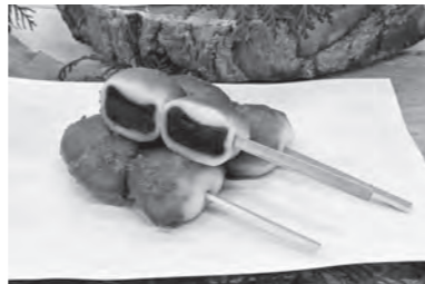
東松山さんぽ やきとり牡丹だんご

※富久屋店頭での販売開始は、2月中旬頃を予定 ※3月27日(金)に2か所で販売会を実施(詳細は市HPをご確認ください)