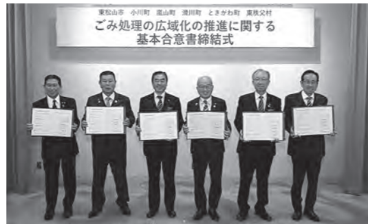
6市町村でスタート!