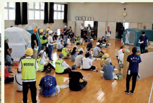
4町合同防災訓練の様子(箭弓町・幸町・美土里町・和泉町町内会)