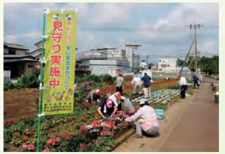
花を植えながら見守り活動「ながら見守り」