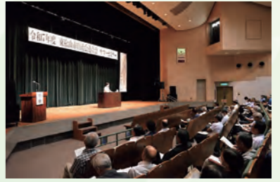
自治会連合会「サマーセミナー」で防犯を学ぶ

よく「自治会加入のメリットは？」との質問を受けます。私たちは「自治会活動の6本の柱」を軸に、自治会独自の取組や各地区、連合会、さらには他団体と協同して、様々な活動を行っています。住民の皆さんが自治会活動の中でご自身の世代や生活スタイルに合った価値を見出しただけだと幸いです。