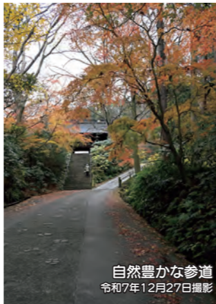
自然豊かな参道 令和7年12月27日撮影