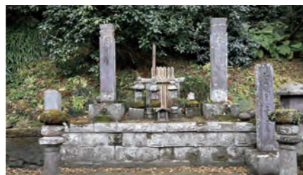
祖師堂近くにたたずむ比企一族の墓