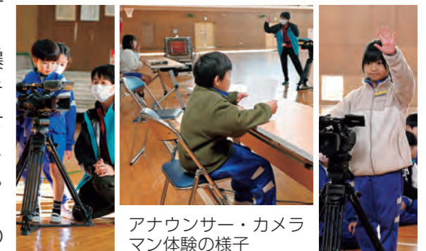
アナウンサー・カメラマン体験の様子