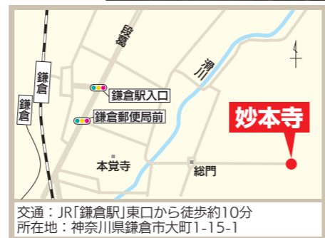
交通：JR「鎌倉駅」東口から徒歩約10分 所在地：神奈川県鎌倉市大町1-15-1