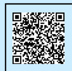
マイナポータルへ