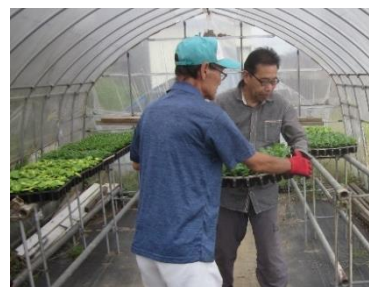
各地区に苗の配送