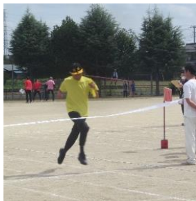
年齢別リレーゴール