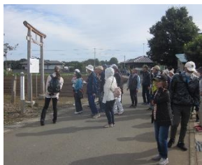
おくま山古墳で休憩

10月23日(木)野本の文化財を訪ねる西コースに93名の参加者がありました。この季節はウォーキングには最適な気温で、気持ちよく歩くことができました。2時間ほどで野本市民活動センターに帰着しました。