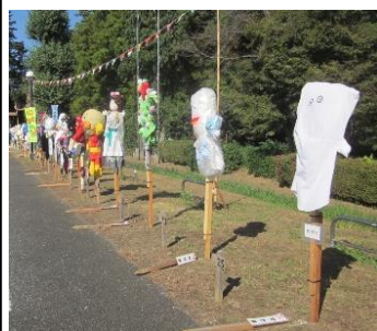
かかし展示(東側南)

今年は各種団体と個人2名から応募があり、合計33体が製作され展示しています。「かかし」は10月11日(土)に搬入し設置しました。かかし祭大賞・デザイン賞・ユニーク賞・話題賞・特別賞・アイデア賞など、出品された作品に応じて、かかし祭選考委員23名が各賞別に投票し、各賞が決定しました。また、今回も小学生部門の大賞が設けられました。