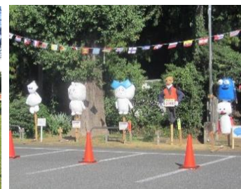
かかし展示(東側中央)