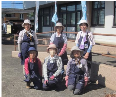
フラワーサポーター6名

10月17日(金)午前10時から野本市民活動センターの花壇に、フラワーサポーター6名のご協力を頂き、花の苗を定植しました。1時間で定植が終わりました。11月末頃には花が咲き始めると思います。