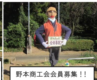
野本商工会会員募集!!