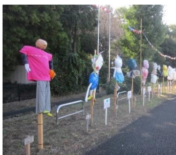
かかし展示(東側北)