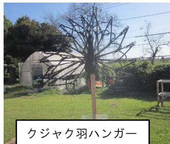
クジャク羽ハンガー