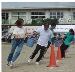
防災バケツリレー