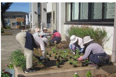
玄関右側花壇に定植