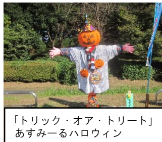
「トリック・オア・トリート」 あずみーるハロウィン