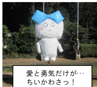
愛と勇気だけが… ちいかわさっ!