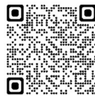
全国版空き家バンク 【アットホーム】