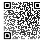
全国版空き家バンク 【ホームズ】