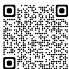
移住促進空き家活用補助金 交付制度【市HP】

空き家バンクに登録された空き家を市外から移住する方が利用(購入・賃貸)する場合は、補助金制度があります。