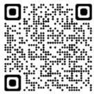
売却希望物件一覧 【市HP】

空き家バンクに登録した空き家を市のホームページや全国版空き家バンクなどで公開することにより、広く周知することができます。そのため、空き家バンクに登録された物件は高い確率で成約されています。