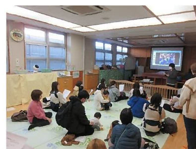
家庭教育アドバイザーによる事前説明会