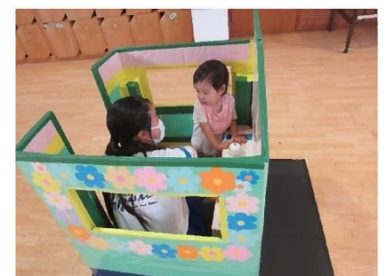
夏のボランティア体験