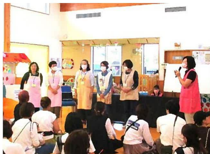
まつりボランティア