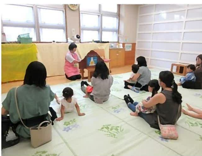
読み語りボランティア