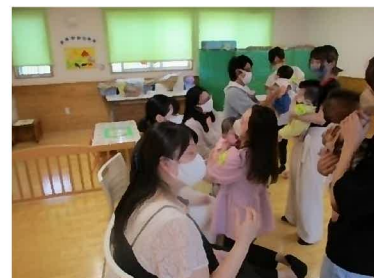
プレママパパ見学会