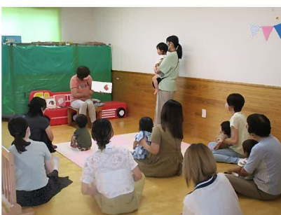
読み語りボランティア