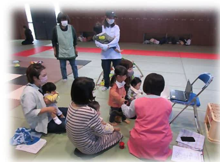
白山中はオンラインで交流