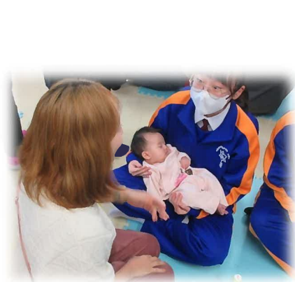
東中は4クラスを2日間に分けて交流