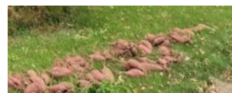
庭に放置されたサツマイモ

〇ミカンなどの果物を生りっぱなしにしていないか 〇収穫した果物や野菜は放置していないか