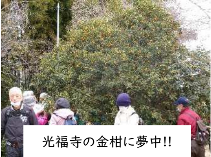
光福寺の金柑に夢中!!