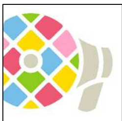
i 広報紙のアイコン

※iPhone・iPad でのダウンロードには Apple ID のパスワードが必要です。