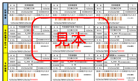
市区町村から送付されるクーポン券(イメージ)

※ 1年目は、昭和 47 年 4 月 2 日から昭和 54 年 4 月 1 日までの間に生まれた男性に対しクーポン券が送付されました。(Q6 参照)